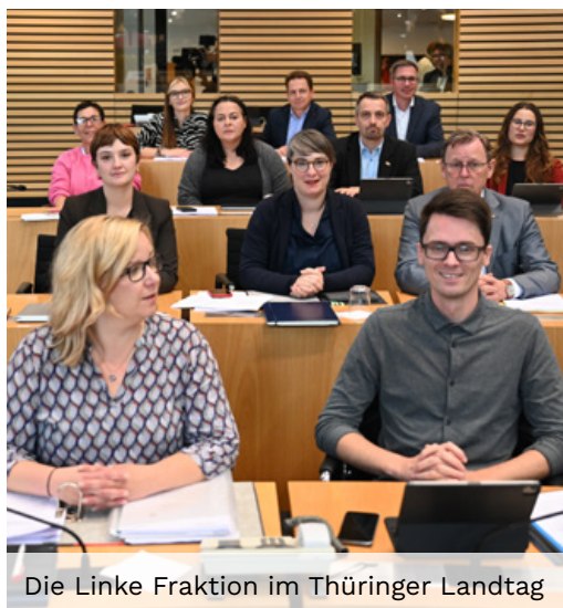
Die Linke Fraktion im Thüringer Landtag