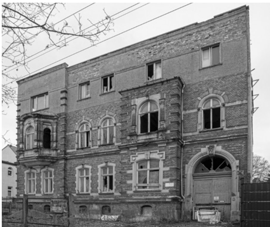
Gebäude der ehemaligen PGH Textilmode heute