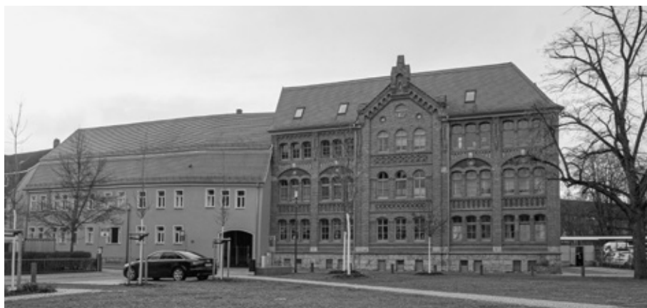
Gebäude der ehemaligen Wegner Strickmoden GmbH heute