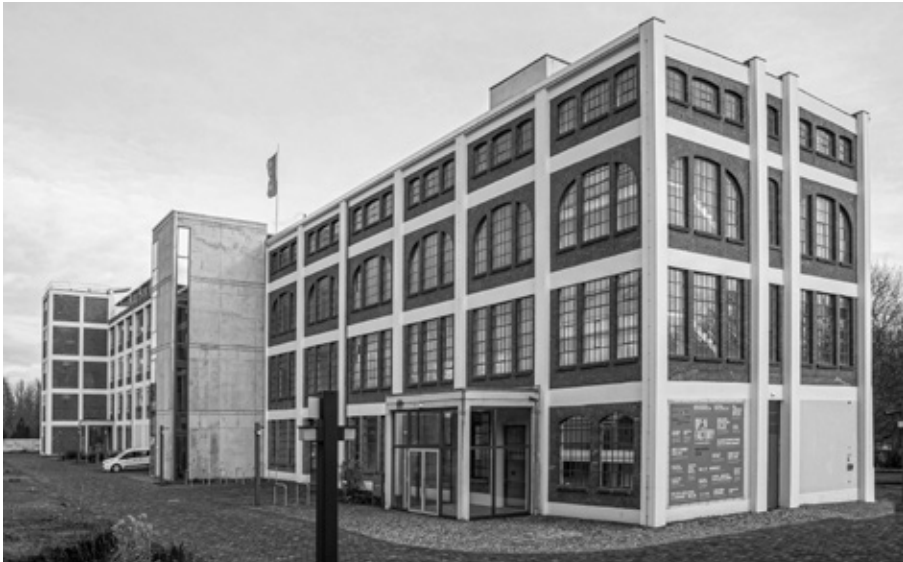
Der Egon-Eiermann-Bau in Apolda