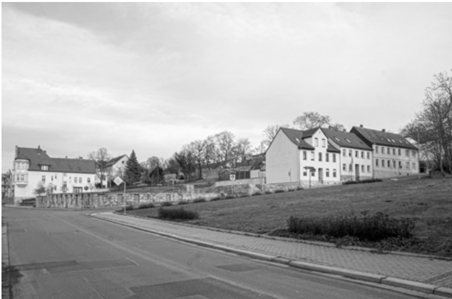
Freifläche in der Apoldaer Innenstadt nach Abriss einer ehemaligen Strickerei

November war unser Antrag auf die Einsicht der Akten immer noch nicht beantwortet. Die Akten lägen beim Thüringer Wirtschaftsministerium, das die Schutzfristverkürzung in unserem Fall aufheben musste. Natürlich fragten wir uns, warum es eine solche Schutzfrist gibt und wurden dann schnell im Bundes- sowie Thüringer Archivgesetz fündig. Archive sind je nach Situation und betroffener persönlicher Daten Dritter dazu verpflichtet, Akten generell unter Verschluss zu halten, um den Datenschutz zu gewährleisten. Das ist eine Erklärung, die wir politisch selbstverständlich unterstützen. Irritierend ist jedoch ihr Anwendungsbereich, denn wir suchten schließlich nicht nach persönlichen Daten, sondern nach Abwicklungsgutachten, Liquidationseinschätzungen und Protokollen von verschiedensten Gesprächen, Verhandlungen und Tätigkeiten der Treuhandanstalt. Gerade, um zu verstehen, warum es in Apolda bis 1990 eine florierende Strickindustrie gab und danach nicht mehr sowie welche Rolle die Treuhandanstalt dabei gespielt hatte.