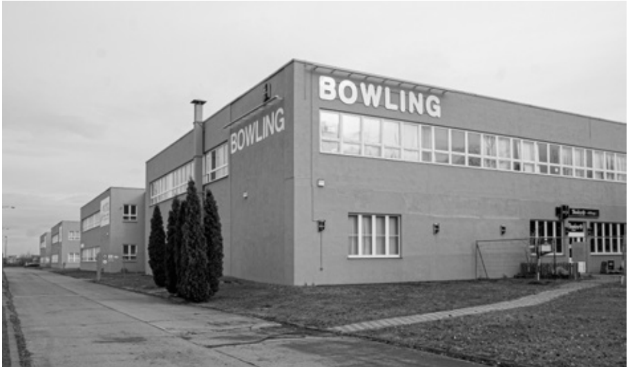
Ehemalige Werkhallen des VEB Thüringer Obertrikotagen Apolda (TOA) heute

Strickmaschinen mit eingespannten Konern im früheren TOA.