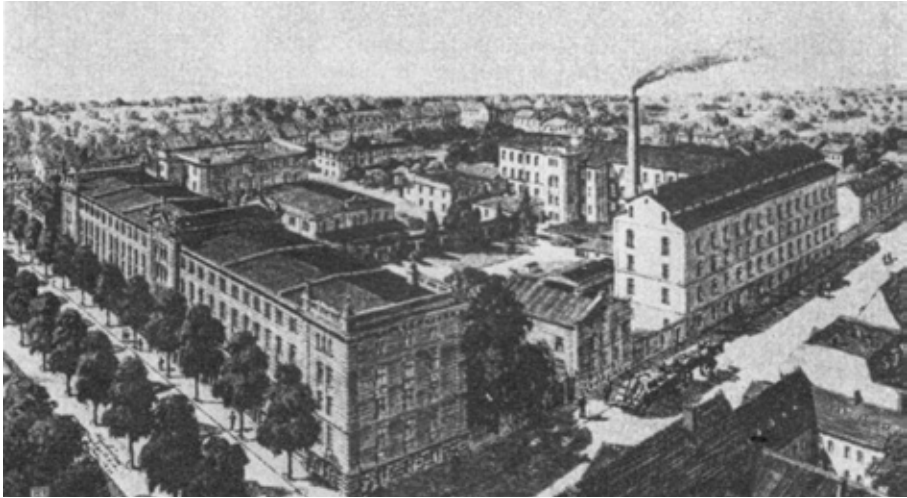
Die Firma Zimmermann & Sohn – heute das Landratsamt – früher