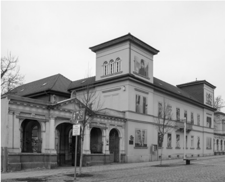
Das GlockenStadtMuseum in Apolda

Die Museumsfassade war zudem in den letzten Jahren Projektionsfläche, um mit außergewöhnlichen Gestaltungen auf die Vermittlung von Museumsinhalten hinzuweisen. War das Museum 2017 mit Musterstreifen bestrickt, erinnerten im darauffolgenden Jahr überdimensionale gestrickte Strümpfe an den Beginn des textilen Gewerbes. Die »Tracking Talents«-Fassade verwies auf experimentelles innovatives Modedesign.