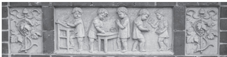
Ornamente an der Fassade des Landratsamtes