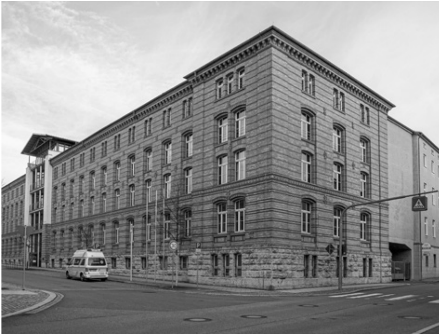
Das Landratsamt heute